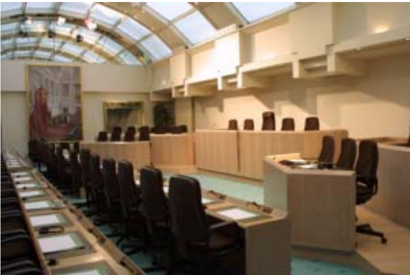
Der internationale Saal

Um dem Publikum die Möglichkeit zu geben, den öffentlichen Ausschusssitzungen beizuwohnen, hat die Kammer moderne Säle wie den Internationalen Saal bauen lassen.