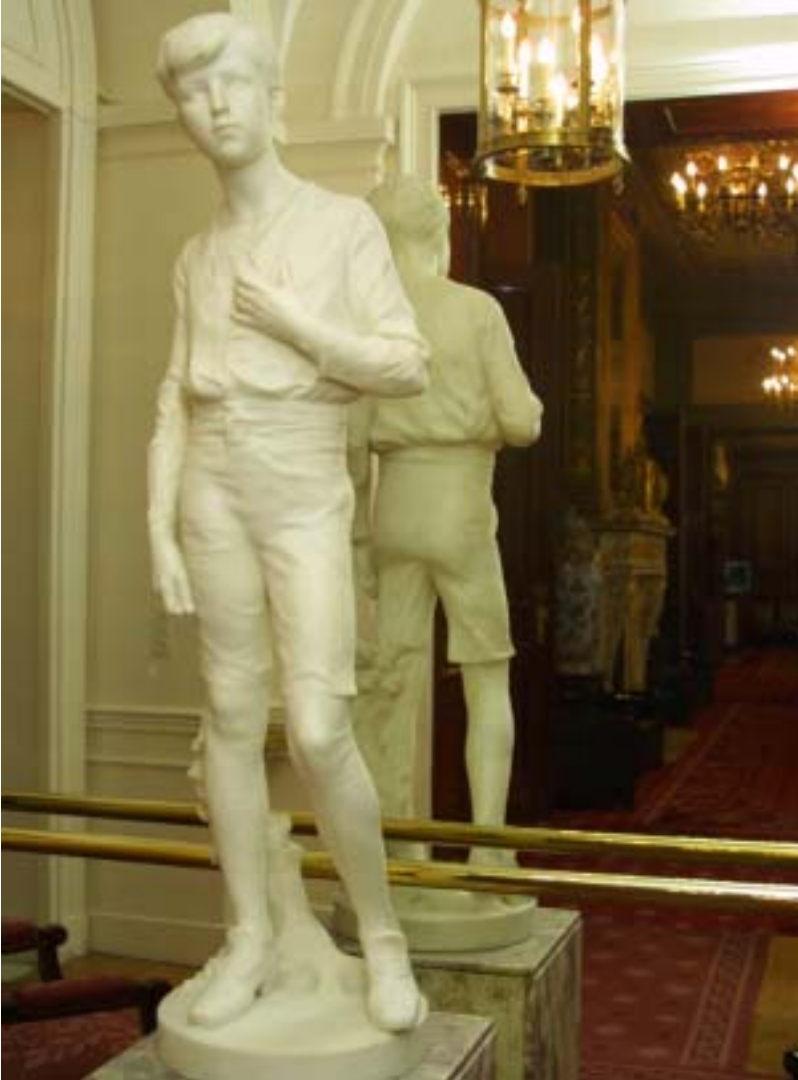
Der Herzog von Brabant, der spätere König Leopold III., von P. Dubois.

Auf dem Gang sehen Sie dann direkt vor Ihnen die weiße Marmorstatue des jungen Herzogs von Brabant , des späteren Königs Leopold III. 73